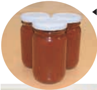
◀完成した試作品の「トマトソース」