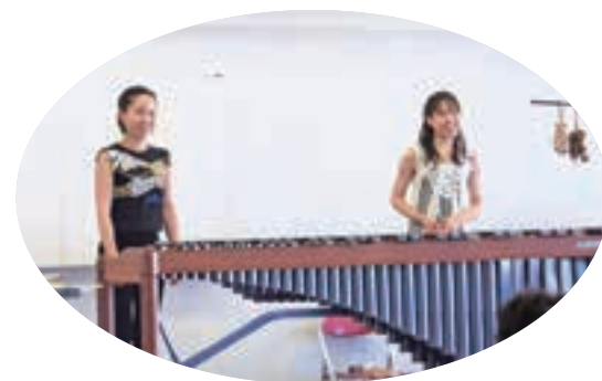
▲マリンバツイングスのお二人