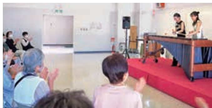
▲手拍子するなど会場は大いに盛り上がりました