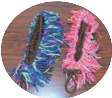
▲完成したハンガーモップ