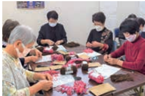
▲根気よく毛糸を結び付けました

J A健康大学追分支部は10月4日、旧追分支店で手芸教室を開き、22人が参加されました。総合家庭雑誌「家の光」の記事を参考に「ハンガーモップ」を作りました。好みの色の毛糸を段ボールに巻き付け、同じ長さにカットして1本1本ハンガーに結び付け、モップの形を整えて完成しました。モップの形を整えるところが難しく、部員同士が教え合いながら互いに協力して作業をしました。おしゃべりしながら作る手芸教室は部員同士の交流を深め、つなげていけます。参加された部員の方は「根気強く毛糸を結び付けるのが大変だった。家の掃除に使いたい」と話されました。