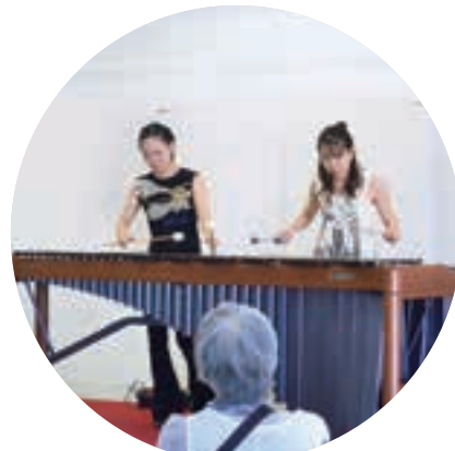
▲迫力ある演奏でした

JA女性部東海田支部は10月2日、東海田支店で、マリンバコンサートを開き、62人が参加しました。安芸郡府中町出身のマリンバ奏者の姉妹デュオ・マリンバツイングスが「川の流れるように」や「デイズニードレー」などを演奏されました。ウインドチャイムやジャンベなどの楽器も登場し、観客のみなさんは手拍子をするなど会場は大いに盛り上がりました。最後にアンコールの声を受けて「ふるさと」を演奏されました。マリンバはアフリカが起源の木琴です。マリンバの生演奏を初めて聴いた観客の方は「幻想的な音色で日常を忘れて癒された」と笑顔で話されました。