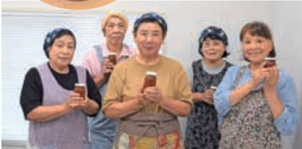
▲試作品を手にする加工部員のみなさん

J A女性部加工部は9月27日、旧追分支店の加工所で、新しい加工品作りの試作会を開き、5人が参加されました。加工部は、管内産野菜で漬物を作り、Aコープ店やイベントなどで販売しています。この度、新たな加工品目として「トマトソース」を試作しました。部員が収穫したイタリアントマトをミキサーにかけ、玉ねぎやにんにくなどを加えて水分を飛ばしながら鍋でじっくりと煮込みました。「トマト自体の甘みや酸味によって調味料の量を変えてみよう」など部員同士アイデアを出し合っておりジナルの「トマトソース」を完成させました。今